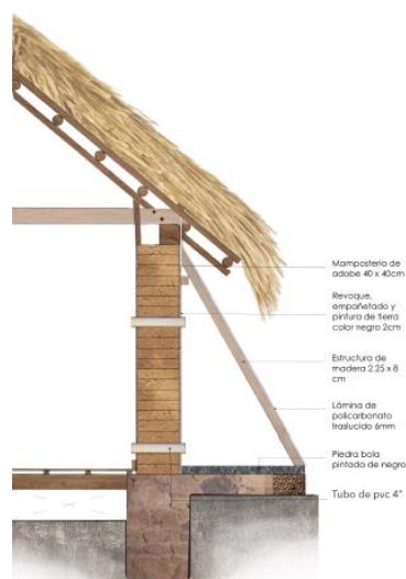
Figura 2. Detalle muro trombe

Se planteó el uso de doble ventana, la exterior de vidrio de baja emisividad con marcos de madera, una ventana interna de madera, lo cual contribuye a mantener el calor en el interior de la vivienda, y permite iluminación natural durante el día. Las puertas son de madera sólida, las ventanas internas son de madera, las externas con marco de madera y vidrio (figura 3). Los pisos son de duela machihembrada sobre una estructura de madera para crear una cámara de aire.