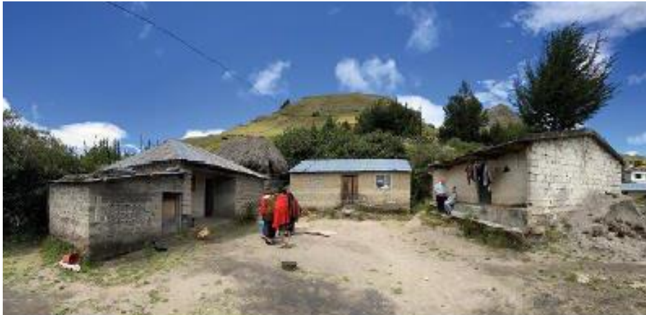
Figura 1. Vista vivienda