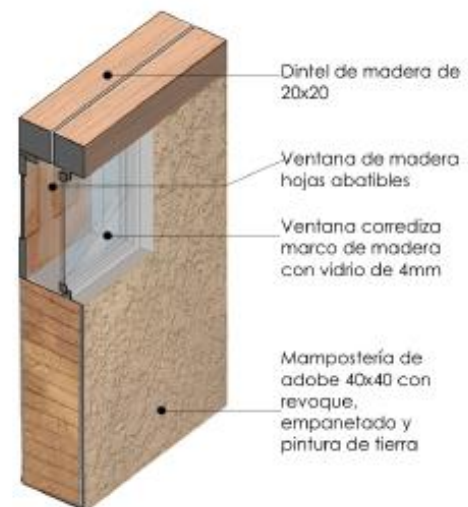
Figura 3. Detalle ventana

Para el diseño arquitectónico del prototipo de vivienda, se definieron espacios que se determinaron de acuerdo con las preferencias resultantes de la investigación, para lo cual se consideró un área de 103 m 2 , la misma que dispone de área familiar destinada a actividades de cocina, comedor y estudio o área de trabajo, un área de descanso con dos dormitorios, un área de aseo con un baño, corredor frontal cubierto, y un área para cuyero y/o bodega anexa a la vivienda (figura 4).