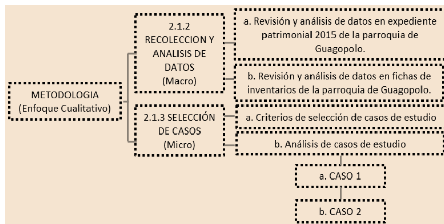
Figura 1. Esquema metodológico

La metodología aplicada para la investigación se llevó a cabo en dos etapas. La primera etapa consistió en una revisión de la información previamente entregada como punto de partida, seguido de la verificación de datos por medio de un análisis del estudio previo realizado, y un análisis de las fichas de inventario, cuyo levantamiento fue realizado en el año 2013. En la segunda etapa se realizó la selección de casos de estudio bajo criterios de selección para su posterior análisis.