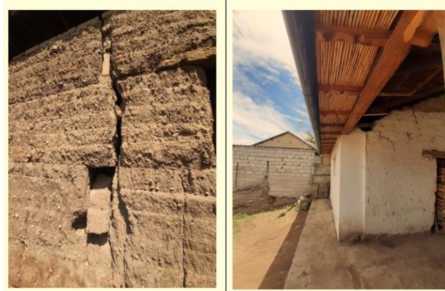
Figura 5. Caso de estudio A: muro de tapial, estructura de madera y carrizo en cubierta

Los resultados obtenidos en el registro y documentación, tanto del caso de estudio A y B, dan cuenta de la memoria colectiva y el legado de la parroquia, poniendo en perspectiva a la arquitectura con tierra como una fuente de conocimientos sobre técnicas constructivas tradicionales, muchas veces sostenibles y adaptadas al entorno (Yépez, 2012). Estas técnicas y materiales no sólo tienen valor histórico, sino que también ofrecen soluciones prácticas y ecológicas para la construcción moderna, promoviendo la sostenibilidad y la eficiencia energética.