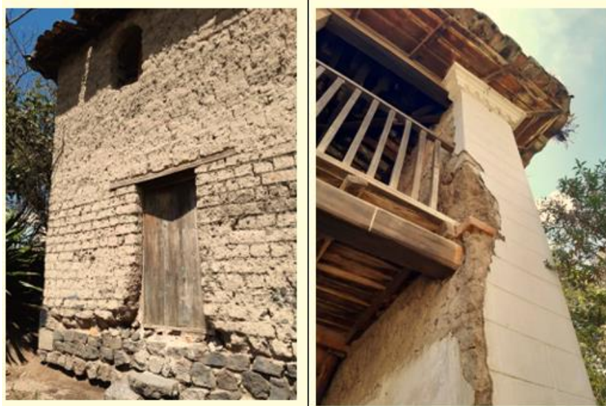
Figura 7. Caso de estudio B: muro de adobe sobre zócalo de piedra

Por otro lado, la conservación de la arquitectura en tierra puede contribuir al desarrollo económico local, por ejemplo, el turismo cultural atraído por la autenticidad y el encanto de estas edificaciones puede generar ingresos y empleo para la parroquia; y así también, fomentar un sentido de orgullo y pertenencia entre los habitantes, fortaleciendo el tejido social (Monteros, 2016). Es por esta razón, que se destaca la importancia de garantizar la conservación de ambas edificaciones como parte fundamental en la construcción de la memoria social y colectiva de la parroquia, su puesta en valor va de la mano de los procesos de documentación y registro.