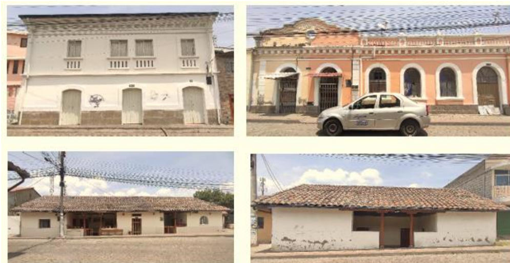
Figura 3. Edificaciones patrimoniales pertenecientes a la parroquia

característico por fachadas sencillas, simples, modestas, donde su valor radica en lo constructivo y lo funcional (Kingman, 1996).