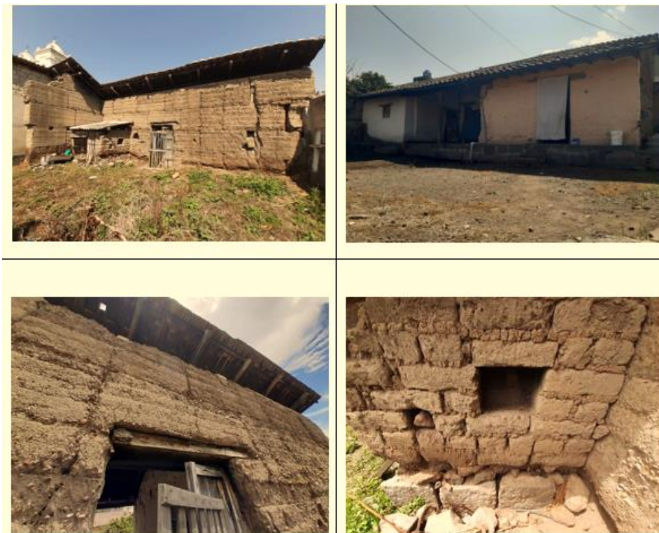
Figura 4. Caso de estudio A: levantamiento de la edificación correspondiente

Actualmente el estudio reflejó una totalidad de 34 edificaciones registradas en el inventario patrimonial en el año 2022, de las cuales tan sólo dos de ellas cumplen con todos los criterios de selección establecidos en la tabla 2. Ambas edificaciones representan de forma tangible los valores culturales identitarios de la parroquia, donde la vivienda rural se manifiesta como un conjunto de edificaciones y espacios que la familia utiliza en su vida diaria, en los cuales se pueden identificar valores multidimensionales que abarcan lo económico, lo social y lo estético-cultural. Es una respuesta natural, inmediata y directa a las necesidades y posibilidades de los usuarios, tanto en términos funcionales, determinados por su estilo de vida relacionado con la tierra, su historia y su cultura, como en términos estéticos, influenciados por las condiciones naturales de la geografía, el clima y el contexto (Hermida; Mogrovejo, 2015).