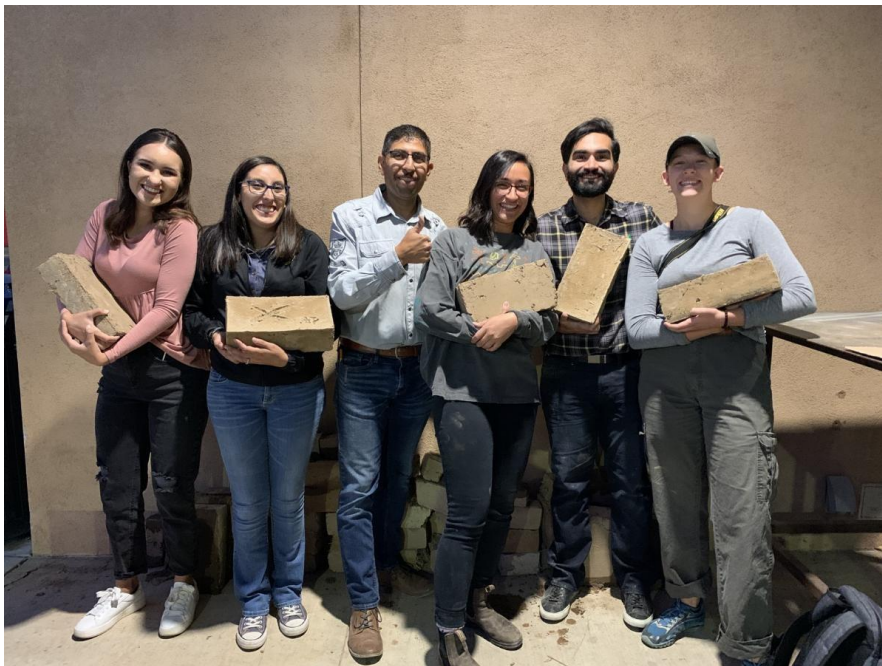
Figura 1. Estudiantes de la clase de Alternative Materials and Construction muestran los adobes fabricados en la escuela de arquitectura y planificación

Los estudiantes experimentan con una gran variedad de suelos a través de pruebas de plasticidad y durabilidad, hasta llegar a una buena mezcla de tierra para la fabricación de un adobe. El riguroso experimento se lleva a cabo en el patio de la escuela de arquitectura, varias muestras se logran desarrollar para después fabricar una serie de adobes de una dimensión de 4x6x12 pulgadas y dejar secar, para después ponerlos a prueba (figura 1).