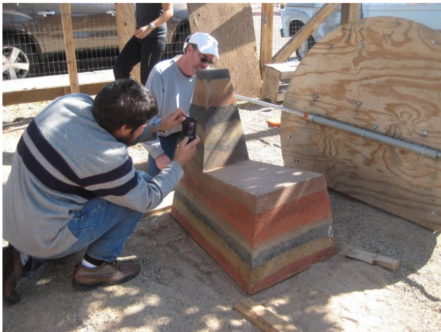
Figura 2. Silla de tapial con pigmentos naturales, fabricada en la vecindad de Barelás, Albuquerque

El proyecto de la silla de tapial ya es parte de muchos sitios por la ciudad de Albuquerque y pueblos circundantes. Muestras de estas sillas se pueden disfrutar y apreciar en el Jardín de la Vecindad de Barelás (figura 2), Centro Cultural para los Indígenas Pueblo, El Instituto los Jardines (ONG), El Museo de los Globos Aerostáticos, El Distrito de Viviendas Sawmill, la Ciudad de Bernalillo, la Escuela Primaria de Coronado, y otras más. Con el tiempo, la exploración de situaciones y funcionalidad de la silla se gestionan para un diseño más sencillo y funcional. Fue así como el proyecto en el Museo de los Globos Aerostáticos requirió otra tipología de asiento. Este curso, dentro del programa de Conservación Patrimonial y Regional (HP+R), al igual que otros otorgan ideas de desarrollo en comunidades, de readaptación de edificios patrimoniales, programas de diseño, levantamientos, identificación de patologías, historia y una extensa planificación de su entorno.