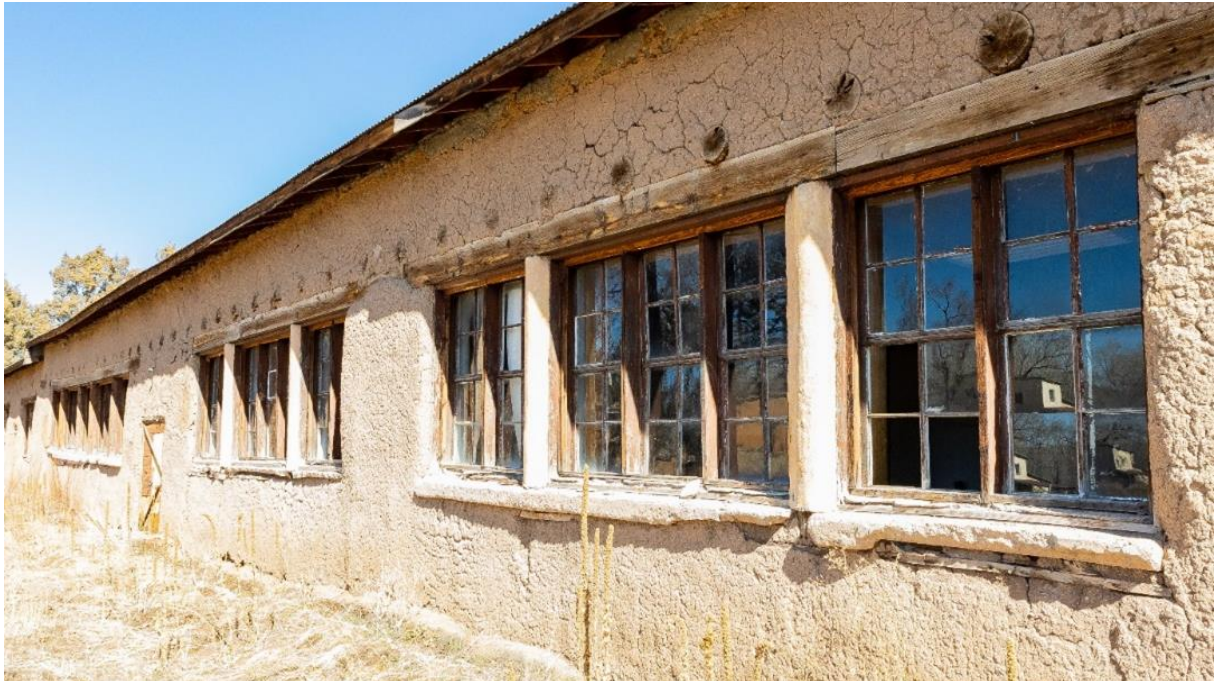
Figura 4. Escuela construida con adobe en la comunidad de Peñasco, Nuevo México