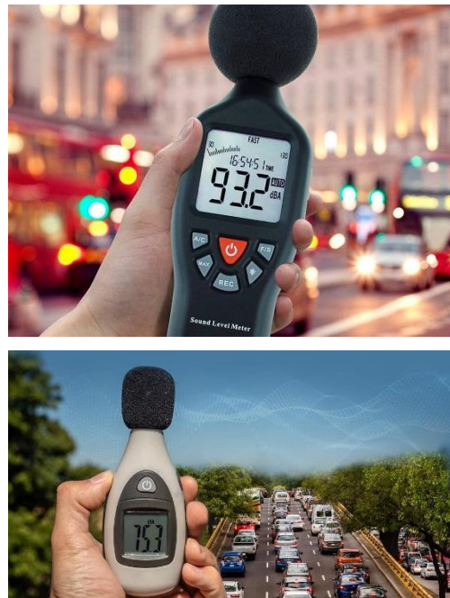
Figura 10. La posición de medición influye mucho los resultados, por lo que medir de acuerdo con normas es imprescindible

En la figura 10 se muestran fotos de sonómetros registrando niveles de ruido que exceden reglamentos ambientales y de salud, ambos en diferentes calles siendo los vehículos las causas principales.