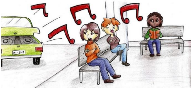
Figura 7. BOOM CARS: ¿Placer - llamar la atención - agresión? (European Acústica, s.f.)

Hay que reconocer que muchos ritos incluyen el uso de ruido (sonidos de alto volumen). Aunque es difícil de probar científicamente muchos autores consideran que, en algunas circunstancias, sobre todo como parte de rituales, el ruido coadyuva a producir placer, y por lo tanto ayudan a que los ritos se vuelvan necesarios, adictivos.