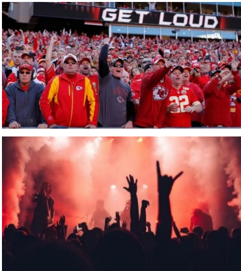
Figura 8 y 9. Ejemplos de ritos modernos masivos ruidosos

Muchos eventos periódicos, como los juegos de fútbol y los conciertos, que congregan a millones de personas, a veces se llevan a cabo en lugares apropiados y con condiciones y duración diseñadas específicamente para ello (Figuras 7 y 8). Sin embargo, hay casos en los que no es así, como las fiestas de fin de semana en casa, que pueden causar molestias a los vecinos.