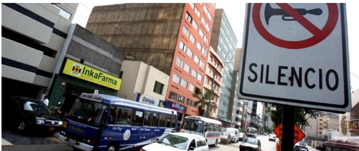
Figura 4. Imagine el sonido recibido en diferentes posiciones del espacio captado por la fotografía. ¿Realmente habrá silencio?

Para visualizar lo complicado del asunto puede imaginarse estar en la situación acústica de la foto de la Figura 4.