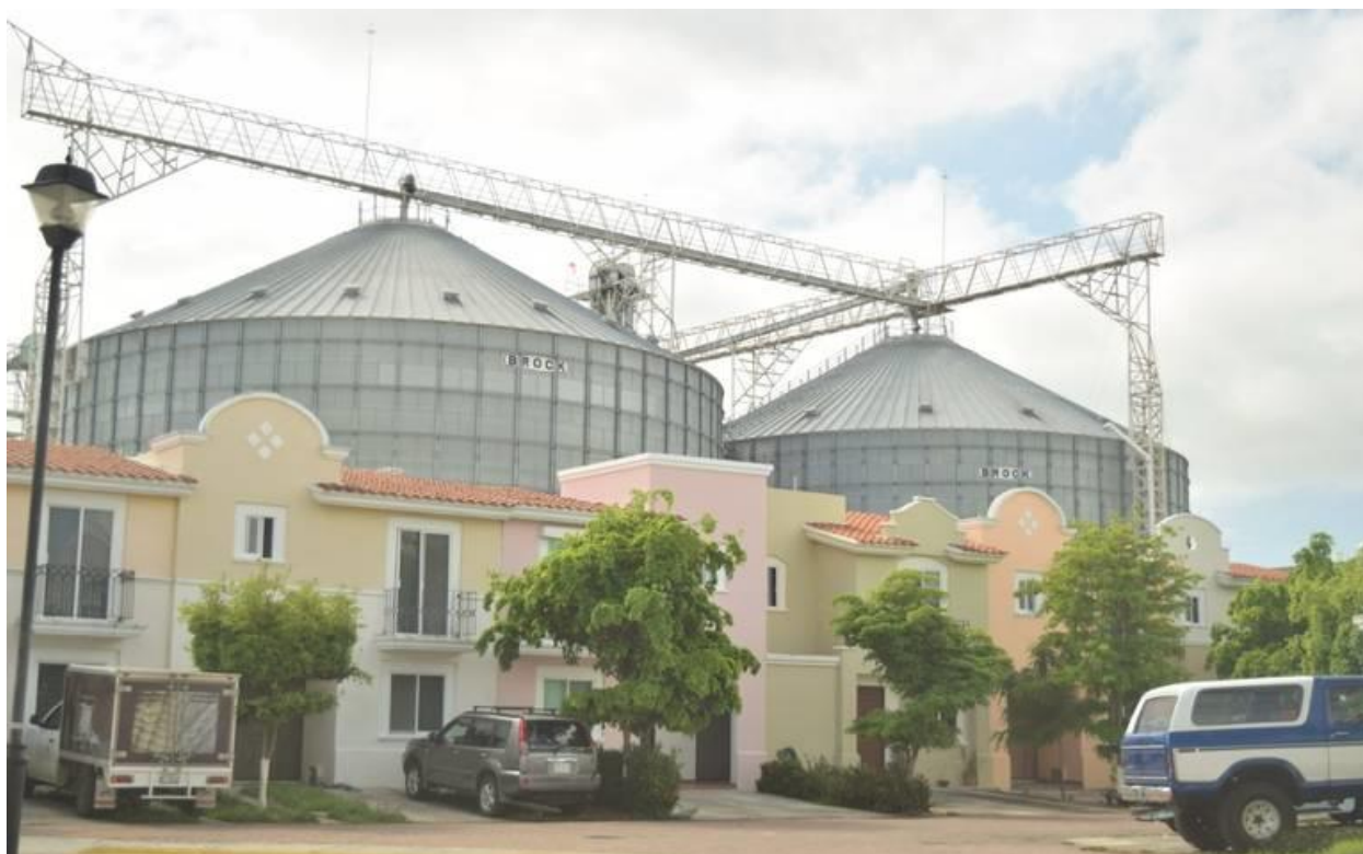
Figura 11. Es común encontrar casa habitación junto a fábricas. ¿De quién fue la culpa?