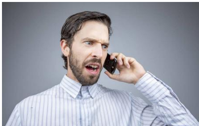
Figura 5. Las quejas por ruido ante las autoridades son de las más frecuentes en las ciudades.

Controlar el ruido cuesta. Puede implicar modificar una máquina, darle mantenimiento, aplicar técnicas de control de ruido o sustituir una máquina ruidosa por una de nueva tecnología más silenciosa. Y claro que muchas veces no hay a quien le interese pagarlo. Para la autoridad “el problema de ruido existe si hay una queja” y solamente el evaluarlas cuesta en equipos, software, inspectores, vehículos, reportes, etc.