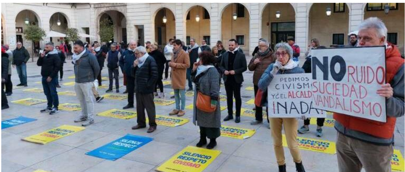
Figura 6. Algunas sociedades actualmente acostumbran protestar por todo problema detectado, incluyendo ruido.

Estos usos del ruido están muy relacionados con los cambios bioquímicos en las personas, principalmente con la edad.