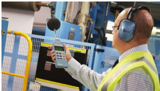
Figura 3. Para poder hacer control de ruido deben efectuarse mediciones de acuerdo con normas

Solucionar un problema de ruido requiere tomar acciones certeras. Esto lo hace un profesional en base a datos y métodos.