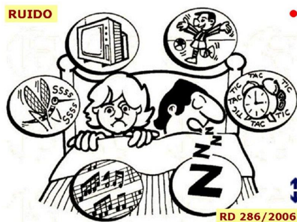
Figura 1. Lo que para una persona es ruido, no necesariamente lo será para otra (Castañares 2017)

Debe tenerse claro que para que haya un ruido debe haber una condición física (energía acústica) y una condición perceptiva (reconocimiento en el cerebro de que hay un problema). No todas las personas captan y juzgan un ruido de la misma manera. Lo que para una persona es ruido, no necesariamente lo será para otra.