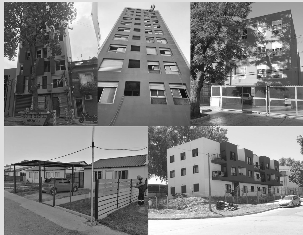
FIGURA 4. COOPERATIVAS DEL PVS.

la promulgación de la Ley de Vivienda han promovido la construcción de miles de nuevas soluciones, el déficit habitacional no decrece. Esto tampoco se debe al cambio de la composición del núcleo familiar, que —si bien se ha verificado— no alcanza a justificar el déficit endémico. No escapan a esta realidad los esfuerzos de las distintas federaciones de programas cooperativos que nacieron y crecieron gracias al marco normativo de la Ley de Vivienda y que, por tanto, no pueden reivindicar las bondades de la ley de la cual son instrumentos. Este relevante fenómeno está confirmado por años de investigación y de análisis que trascienden el alcance de este artículo.