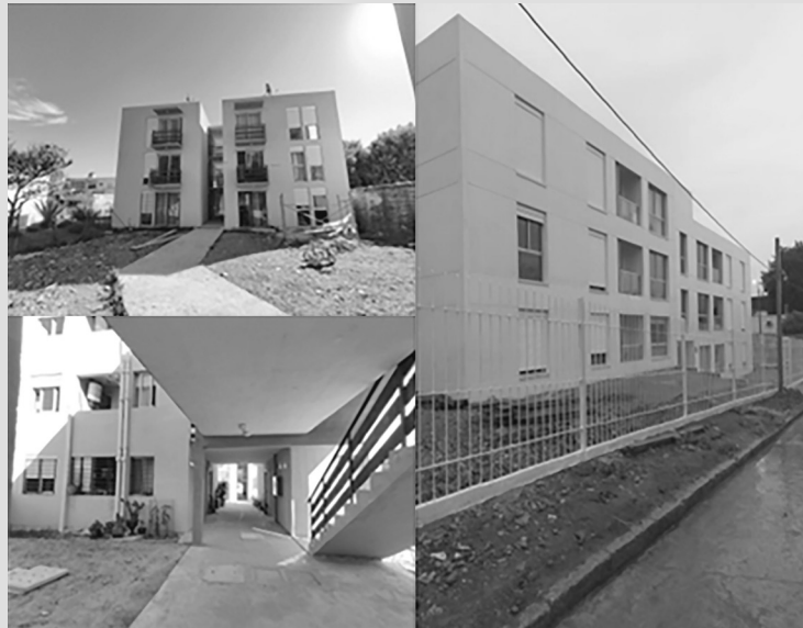
FIGURA 5. COOPERATIVAS DEL PVS ESTUDIADAS.

En general, la ayuda mutua de las cooperativas no está integrada por especialistas de obra o constructores, lo cual implica un esfuerzo paralelo de aprendizaje que recae sobre los cooperativistas, que mientras tanto deben continuar con su trabajo o sustento habitual, así como sobre la eficiencia del trabajo en obra y los mayores costos o demoras que implican que el plantel estable o el capataz dediquen parte de su tiempo a enseñar, dirigir y controlar el trabajo de los cooperativistas. Estos revisten la doble condición de peones de obra gris ayudantes de especialistas contratados y, a la vez, de volitivo contratante, lo cual produce conflictos funcionales y jerárquicos. Tales situaciones se exacerban por la multiplicidad de tecnologías constructivas disponibles como alternativa.