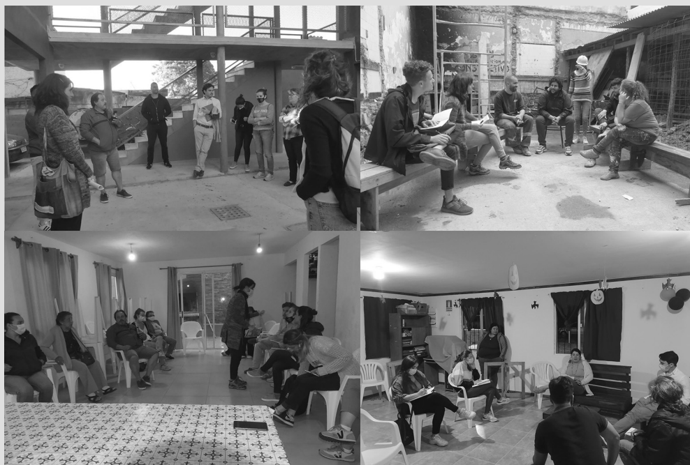
FIGURA 3. ENTREVISTAS COLECTIVAS REALIZADAS.

Pese a que la población del Uruguay crece a una tasa muy lenta y pese a que todos los gobiernos —de todas las filiaciones políticas— sucedidos desde