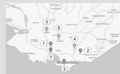
FIGURA 2. UBICACIÓN DE LAS COOPERATIVAS ESTUDIADAS EN EL TERRITORIO DE MONTEVIDEO.

Si bien los resultados del análisis de los relatos colectivos de las cooperativas están en proceso, una lectura preliminar de los mismos sugiere que, más allá de que el PVS es efectivamente valorado como una solución a la problemática habitacional, los plazos y costos constructivos no fueron los previstos originalmente. Esto implicó que, con sus singularidades, las cooperativas atravesaran dificultades económicas, constructivas y burocráticas que dificultaron el de por sí complejo proceso colectivo de producción de viviendas.