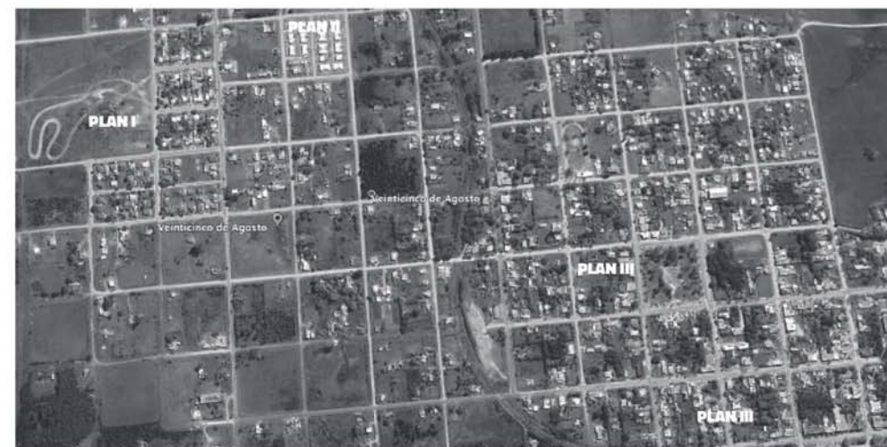
FIGURA 1. 25 DE AGOSTO. EMPLAZAMIENTO DE LOS PLANES I, II Y III.

El lugar de emplazamiento de los distintos planes resulta importante, teniendo en cuenta que la intencionalidad política de Mevir en los últimos años ha sido trasladar sus propuestas desde una ubicación periférica a una central. El suelo es un aspecto importante si se lo tiene en cuenta tanto desde el punto de