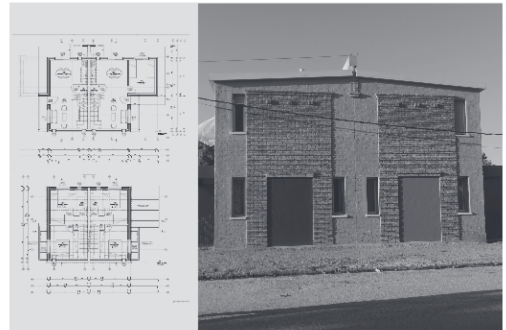
FIGURA 4. PLAN III.