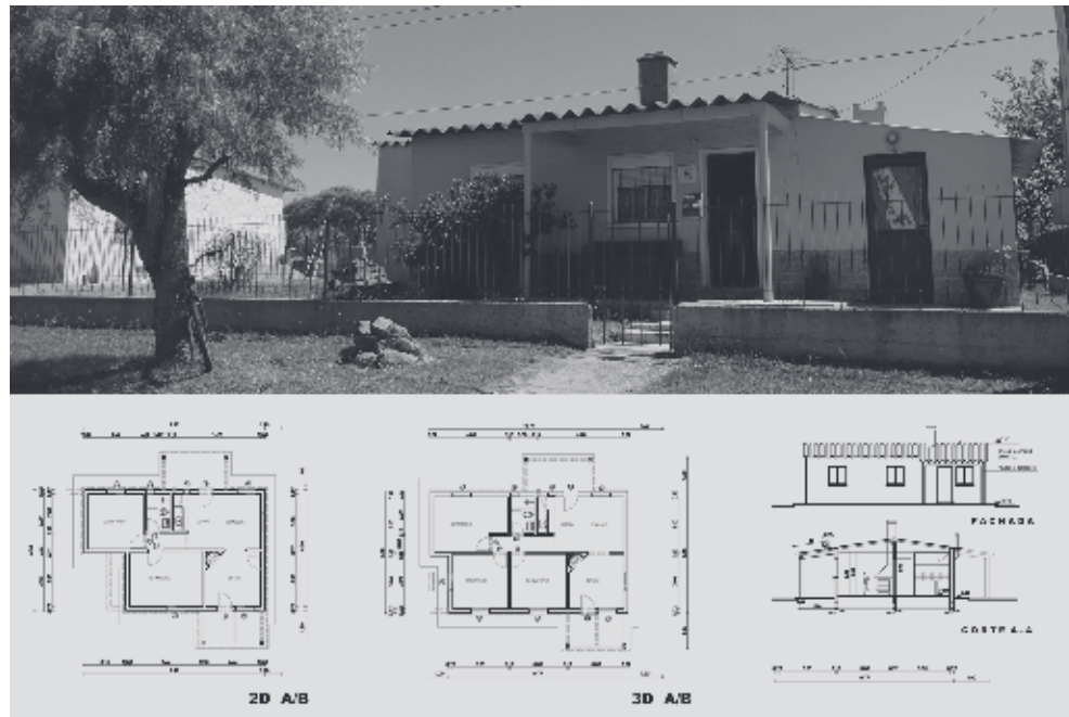
FIGURA 2. PLAN I.